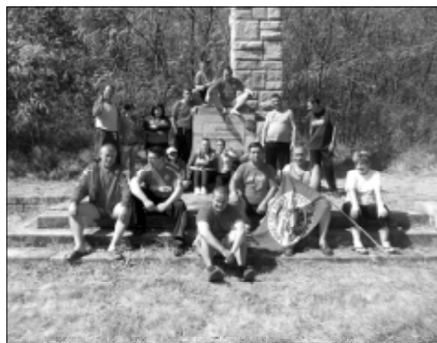
На 03 и 04 Август на паметника на загиналите през 1940 год. парашутисти в местността Домуз дъре привържениците на армейците от с. Оризари и техните приятели провеждоха своята традиционна среща.