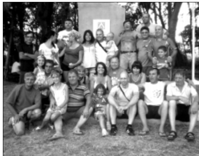
В последната събота на месец юли 2012 г. привържениците на ПФК "Левски" засвидетелстваха обичта си към "синята лавина" в местността "Ливадите" при "Калинина чешма".