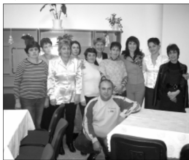
Колективът на ДСП

Днес ДСП Твърдица е социална услуга в общността, която извършва комплекс от социални дейности: доставка на храна по домовете; поддържане на личната хигиена и хигиената в жилищните помещения, обитавана